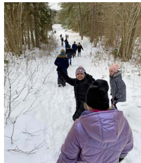
Roela kooli 3. klass liikumisvahetunnis.