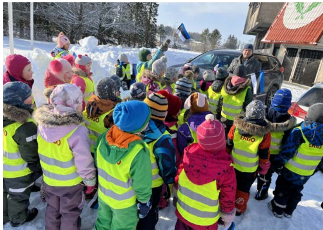
Vinni lasteaed Tõruke.