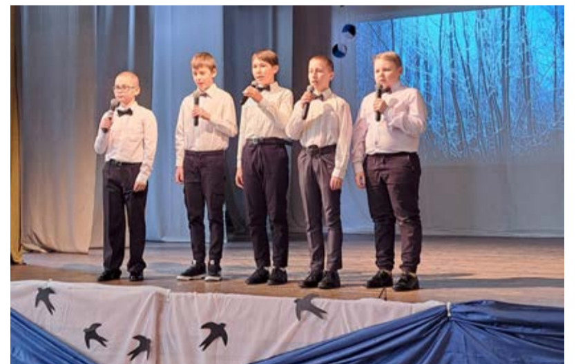
Laulupoisid Roela rahvamajas.