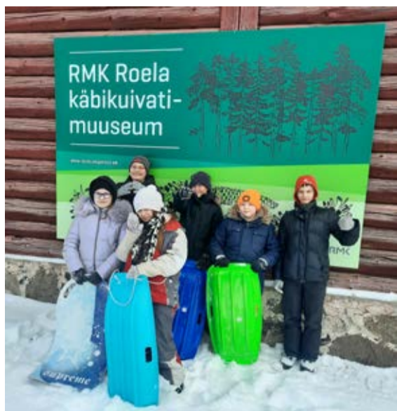
Roela kooli 5.-6.klass vastlapäeval.