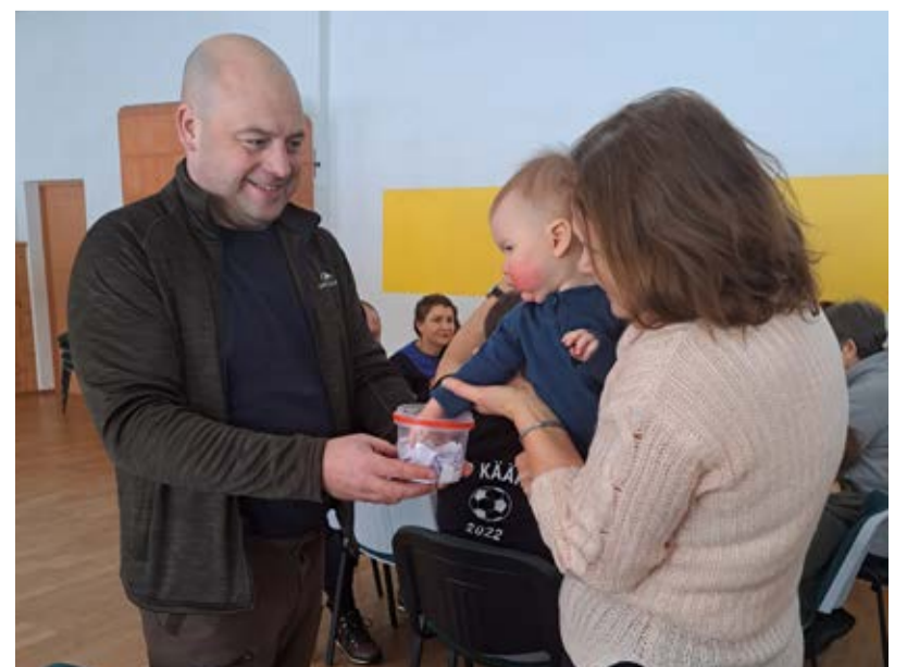
Ja nii kiluvõileibade õnnelik võitja välja loositigi.