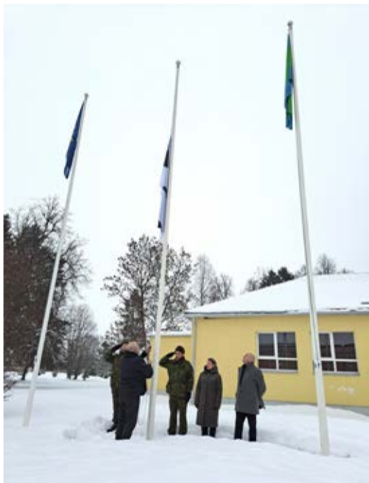
Riigilipu piduliku heiskamise hünni saatel.