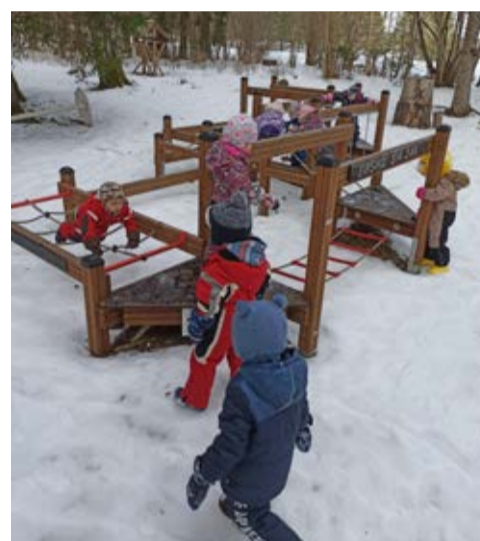
Roela lasteaialapsed Sipsiku Siksakil.