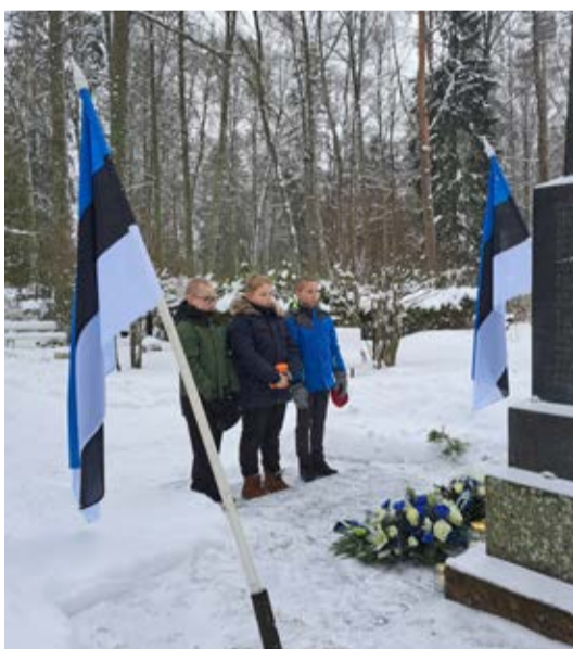
Mälestame neid, kes on Eesti Vabariigi vabaduse eest langenud.