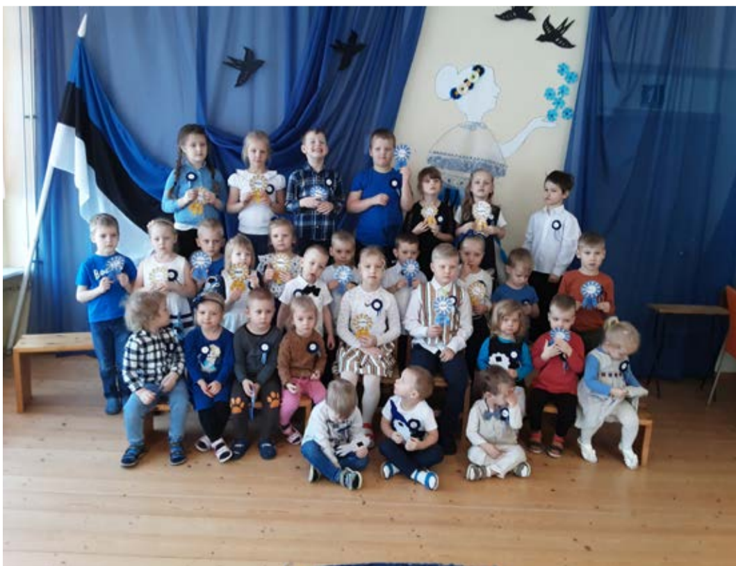
Eesti Vabariigi sünnipäeva tähistamine Kulina lasteaias.

Kulina lasteaia Lepatriinu rühma õpetajad