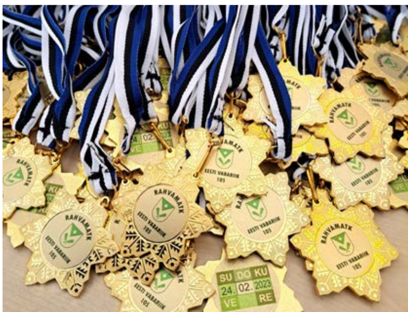
Kõik matkalsid said kaela uhke medali.