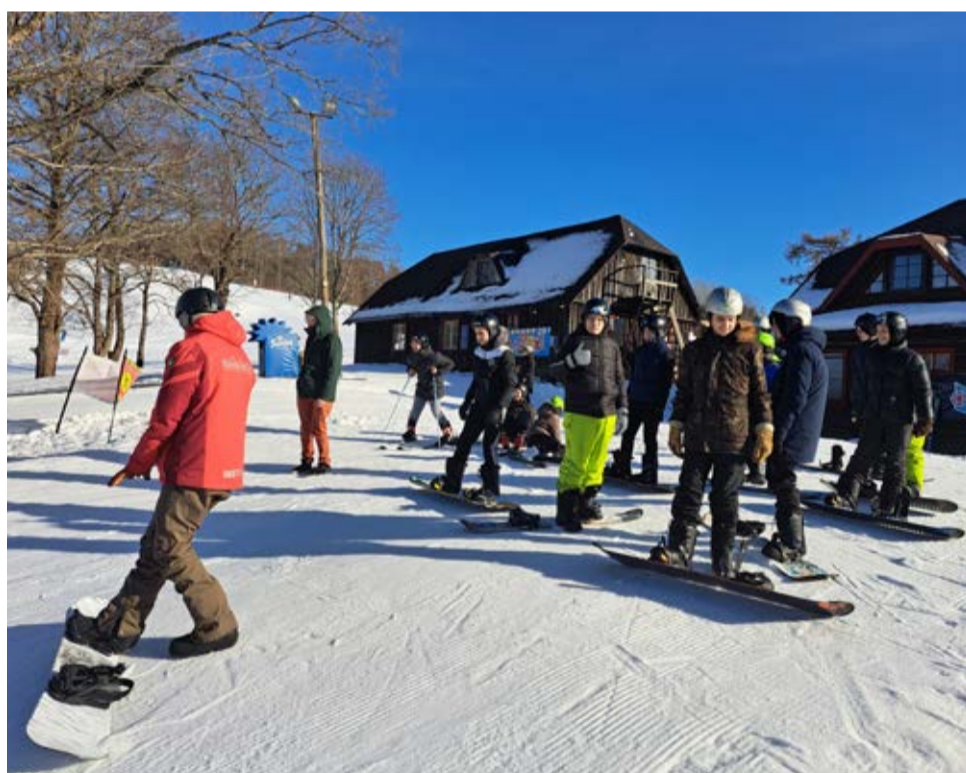
Roela kool Kuutsemäel.