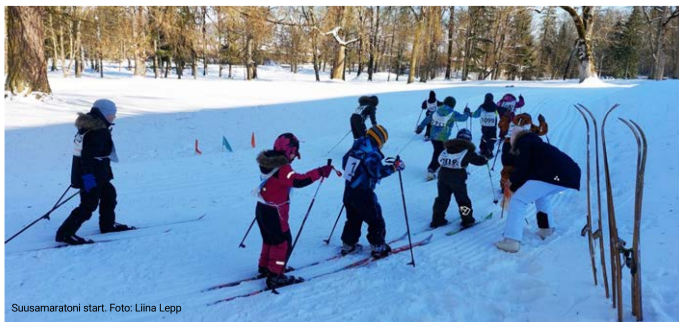
Suusamaratoni start.