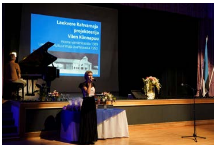
EV105 ja Laekvere rahvamaja sünnipäeva tähistamine.