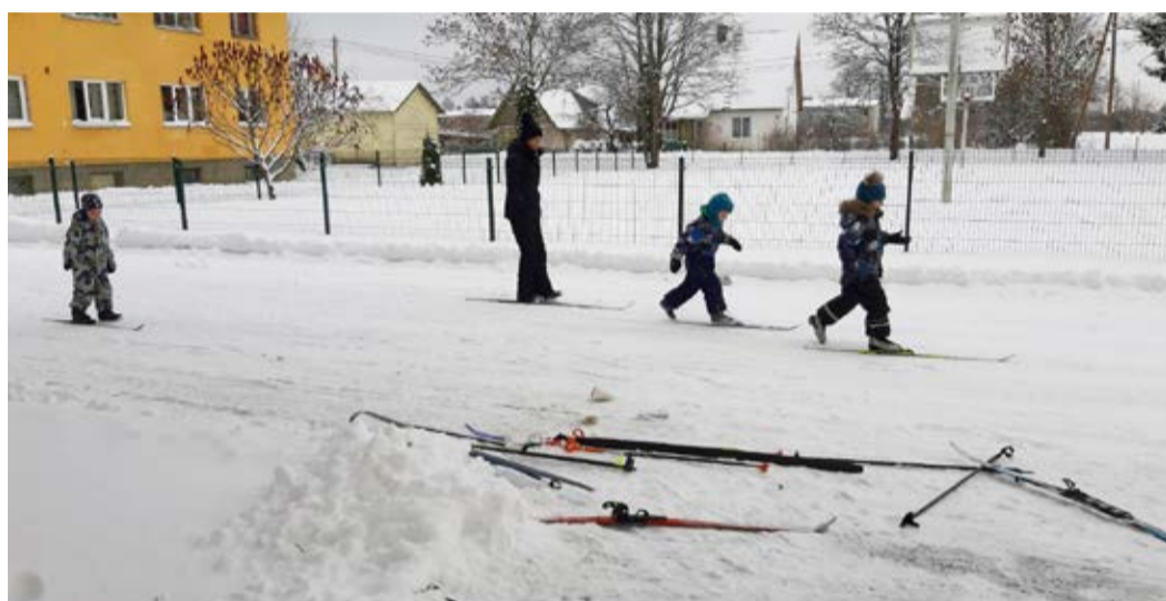
Tudu laste esimesed libisemisharjutused.