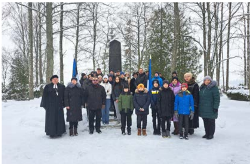
Vabadussõja mälestussamba juures Viru-Jaagupis.