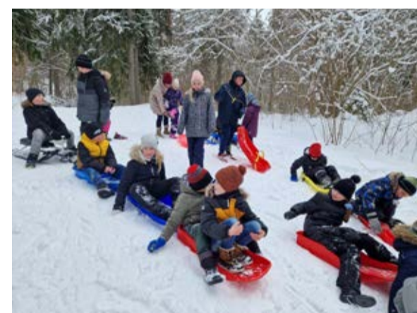
Roela kooli vastlapäev.