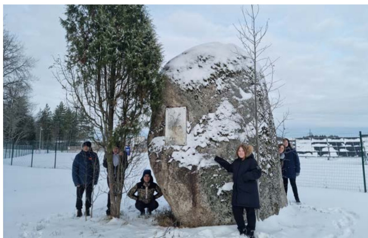
Roela kooli 8. klass liikumisvahetunnis.