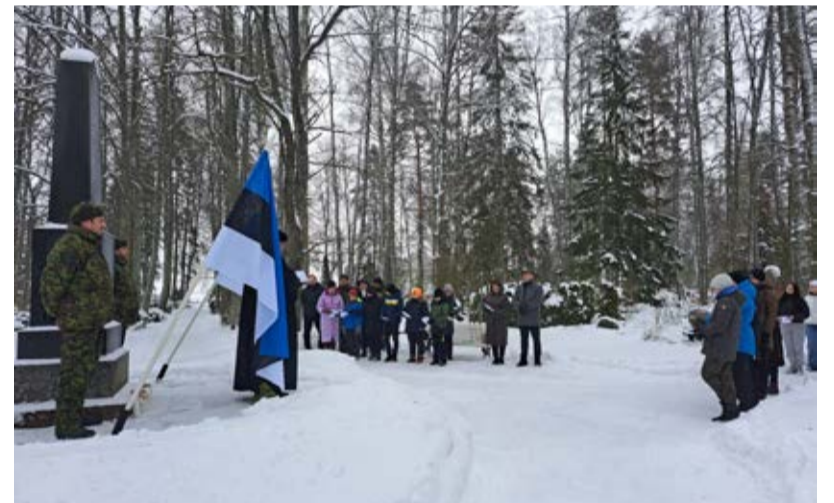
Vabadussõja mälestussamba juures avaldati austust ja tänu neile, kes Eesti Vabariigi vabaduse eest on langenud.