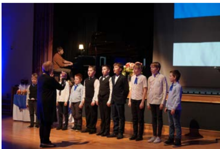
Laulupoisid Laekvere rahvamajas.