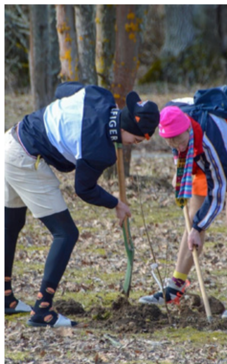
Traditsiooniline puu istutamine kooli territooriumi- le lõpetajate poolt.