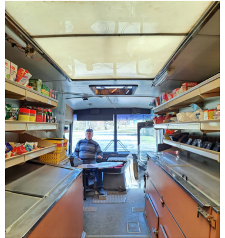
See 2008. aastal Võru Tarbijate Ühistult ostetud kauplusauto vurab Vinni vallas ringi teisipäeviti ja reedeti.

Üks seik oli nii: mulle räägiti, et üks memm kurtis, et kunagi oli tema maja juures käinud kauplusauto, aga siis see kadus ära. Mulle öeldi: „Mine sina!“ Olin nõus ja kui me memmega kohtusime, siis ta hakkas nutma – tal oli nii hea meel kauplusauto saabumise üle! Siis ma käisingi seal memme elupäe-