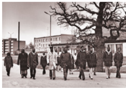
Aafrika arengumaade ametiühingu delegatsioon suundumas Vinni klubist spordihoonesse 1978. a.

sellest, mida nägin nendest, ka Prantsuse külades, kus minu elu möödub, siis võiks ka selles kauges Prantsusmaas palju huvitavaid asju teha.“ 26. juulil oli külalised S. Kirovi nim näidiskalurikolhoosist, 27. juulil Kaug-Idast Burjaadi ANSV-st. 30.–31. juulil tutvusid Vinniga Hiiumaa majandite juhid ja ja rajooni põllulalituse töötajad.