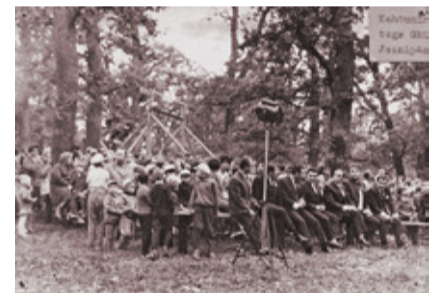
Vinni NST sõbrad Gruusiast Vinni tammikus Kiigemäel jaanipeol 21. juunil 1975. a.