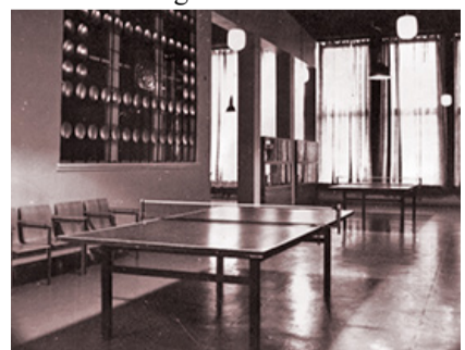
Vaade II korrusel asunud lauamängude ruumi 1976. a.

22. veebruaril uudistasid Vinni spordihoonet külalised Moskva Kehakultuuri ja Spordi Instituudist, 5. märtsil tutvusid nõukogude spordi alustala, kehakultuurikompleksi „Valmis tööks ja NSVL kaitseks“ (VTK) alase tööga Vinnis vastavate instantside esindajad üleliidulises kehakultuuri- ja spordikomiteest. VTK-alane töö sovhoosirahva spordimeisterlikkuse tõstmisel oli huviorbiidis 31. märtsil Vinnit väisavatel järgmistel üleliidulistel spordiasjameestel. Moskva külaliste arvates oli siin inimesel kõik olemas tööks ja vaba aja veetmiseks, sportimiseks, ta ei pea selleks linna sõitma. 1975. aastast pöörati üle nõukogudema suur rõhku sportmassilisele tööle, VTK-alane tegevus võeti sotsialistliku võistluse arvestusse. Näidismajandile kohaselt sammus Vinni NST siingi esirinnas.