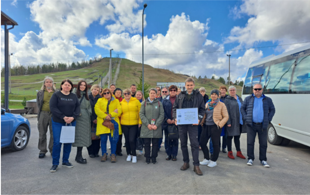
Ühispiilt tuhamäe foonil.