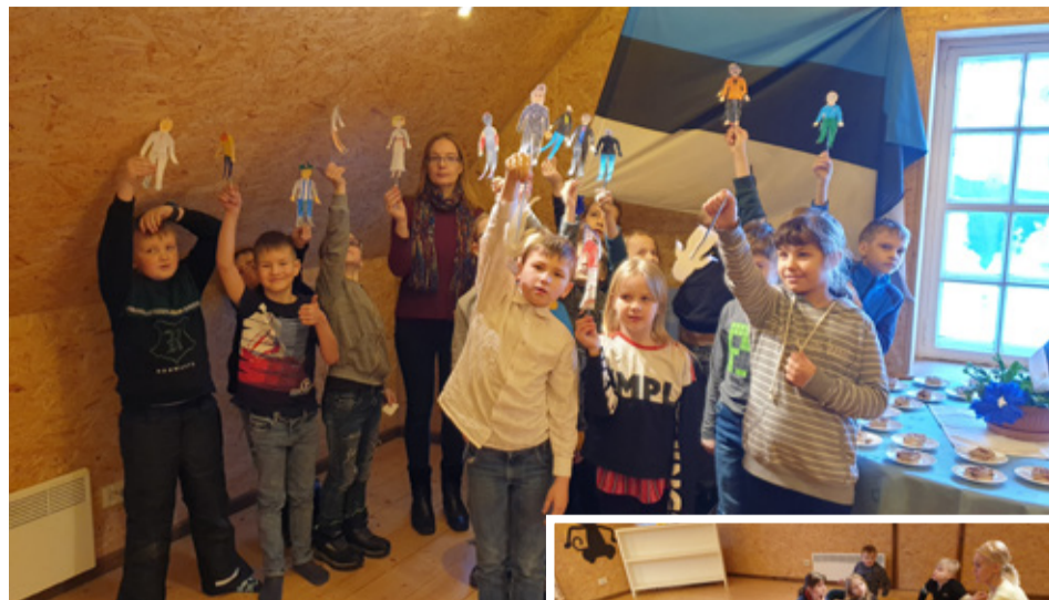
Üleval: Presidendi vastuvõtt muuseumis. Paremalt: Muuseumitundi kuulamas.

1.v ja 2.b klassi õpilased osalesid õppeaasta vältel mitmel korral Rakvere linnakodaniku majamuuseumi muuseumitundides. Tunni- teemad olid seotud erinevate tähtpäevadega. Joulude-eelses tunnis said lapsed ise valmistada ja kaunistada piparkooke. Vabariigi aastapäeval osales iga muuseumitunnis osavõtnu lausa presidendi vastuvõtul. Presidendi paar valiti laste endi hulgast. Selleks pani iga õpilane sedelile kirja kõige sõbralikuma lapse nime. Salajase hääletuse tulemusel selgusidki president ja tema saatja, kes kõiki kohaletulnuid vastuvõtul tervitasid. Lihavõttepühade-eelses tunnis räägiti selle püha kommetest, traditsioonidest ja toitudest. Koostegevuse käigus valmis väga maitsev munavõi, mis mustale leivale määratuna lausa sulas suus. Kõikides tundides olid ka meeoleolukad rahvuslikud mängud ja mõõduvõtmised.