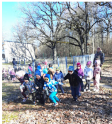
Mälestusjooks.