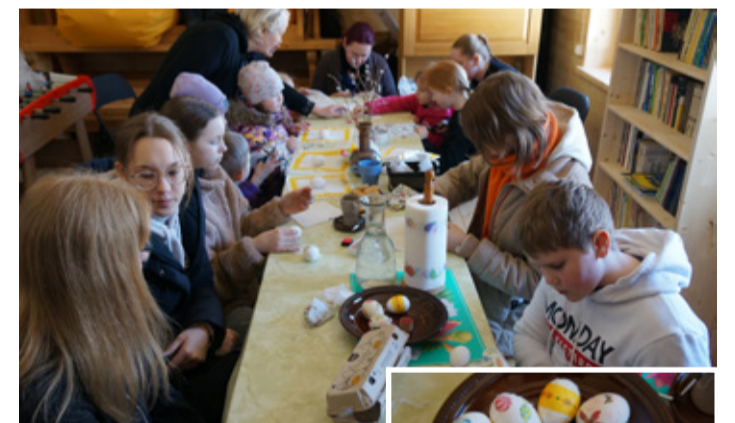
Salvrätitehnika ja kirjud pühade muna.

kevadisitalgutõid tehtud. Kümne-konna inimesega koristati mahalangenud oksa, riisuti lehti, tehti lõket ja söödi talgusuppi. Sellel aastaajal on pargiaasa sarapuude all külluslikult üläseid, silmarõõmu pakuvad ka niisketel kohtadel