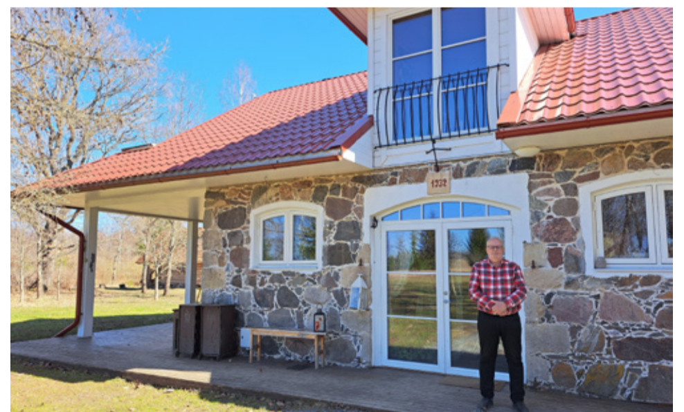
1932. aastal ehitatud maakividest hoone, mis hiljem lagunema hakkas, on tänaseks päevaks väärikalt taastatud ja kohandatud elumajaks.

Juba aastaid tagasi, kui linnupesade määramise koolitusi tegin, öeldi mulle, et võiksin linnupesade määraraja teha. Toona aga olin selles osas skeptiline, ütlesin, et ma ei oska. Nüüd aga mõtlesin välja, milline üks määraraja peaks olema ja see saigi tehtud. Kindlasti tuleb ka edaspidi neid tooteid, mis inimestele linnu tutvustavad. Ideedest esialgu puudust ei ole! Kuna ma olen eluaeg lindude propageerimisega tegelema, tahan läbi raamatute jätta maha jälje, et minu teadmised ei läheks kaduma. Kõik, mis on raamatusse kirjutatud, jääb.