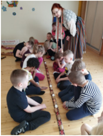
Juurde foto: Päikesemäng.

Meeleoluka päeva eest täname programmi juhti Terje Puustajat.