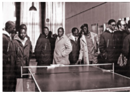
Aafrika arengumaade ametiühingu delegatsioon Vinni spordihoones 1978. a. Aafrika arengumaade ametiühingu delegatsioon käis Vinnis ka 1974. a, siis kuulus sinna esindajaid Kongost, Senegalist, Zairist, Mallist, Gineast, Ülem-Voltast, Kamerunist, Niigerist, Bahamalt.

2. septembril olid Vinnis naabrid Rakverest, 3. septembril õhkas grupp seltsimehi Kemerovo linnast Siberist: „Prosto velikalepno!“ (lihtsalt imeline!). 9. septembril väisasid Vinnit külalised Vene NFSV-st Jaroslavlist, 16. septembril Saksa FV-st Kielist. 17. septembril kiitsid Aseri Keraa-