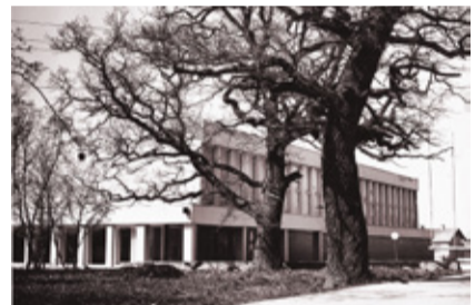
Vinni spordihoone 1970ndate keskel.