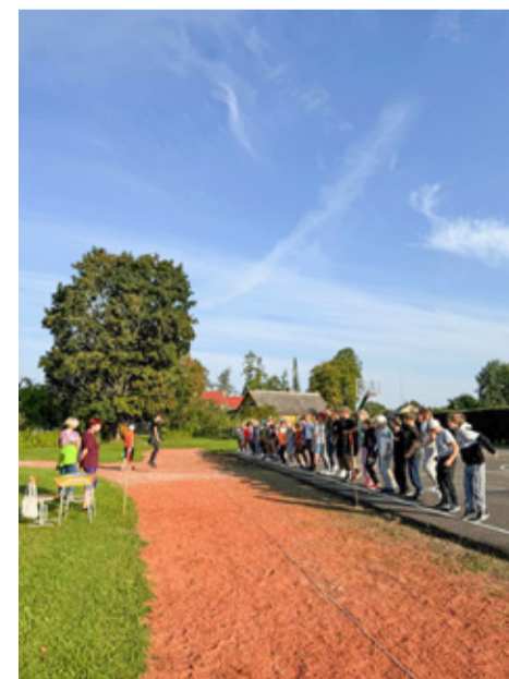
Noorte spordipäev.

17. septembril korraldas Liikumislabor koolituse „Ideeeminar“, mis andis meile hea ülevaate sellest, mida teised koolid juba õuevahetundide võimaldamine. Lühiajalisteks eesmärkideks on meil liikumispause tegemine kõikides ainetundides, mängu- ja tantsuvahetundide läbiviimine ning aktiivse koolitee rakendamine, mis tähendab seda, et