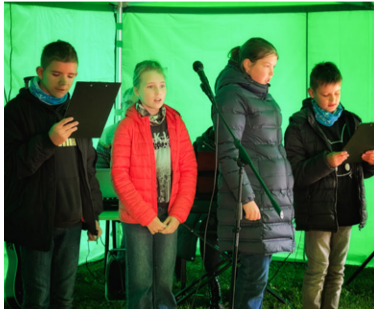
Oma tervituse tegid ka perekodu lapsed.