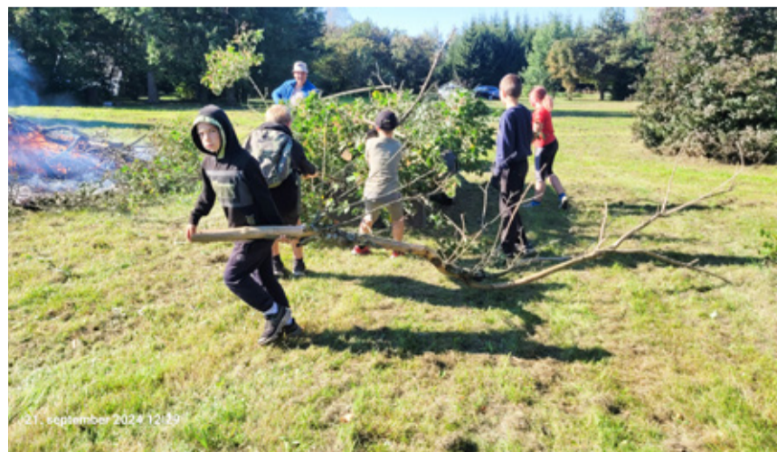
Sellel aastal korrastati talgute käigus Laekvere parki.

Lühikese päeva jooksul jõuti lõkke ääres kõhutäidet nautides ka edasiseks plaani pidada. Ühiselt oldi arvamusel, et