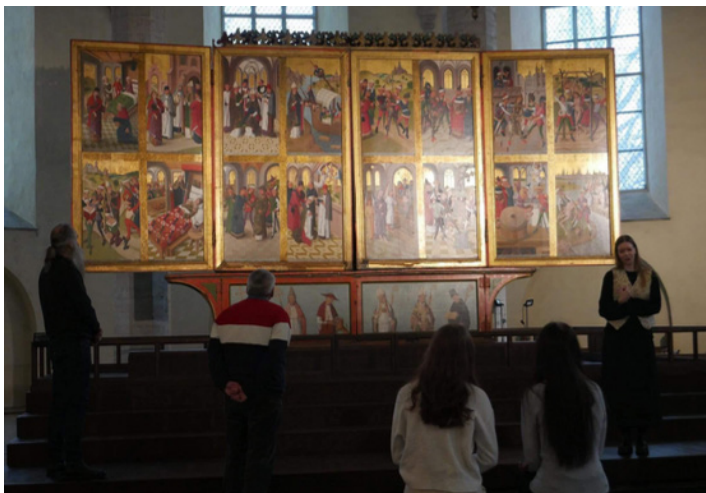
Põnev oli ka kiriku ajalooa tutvumine.