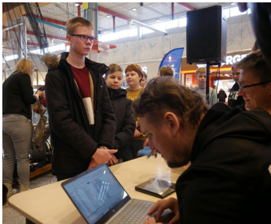
VPG noormeeste jaoks oli see esimene võistlus Derbydel.