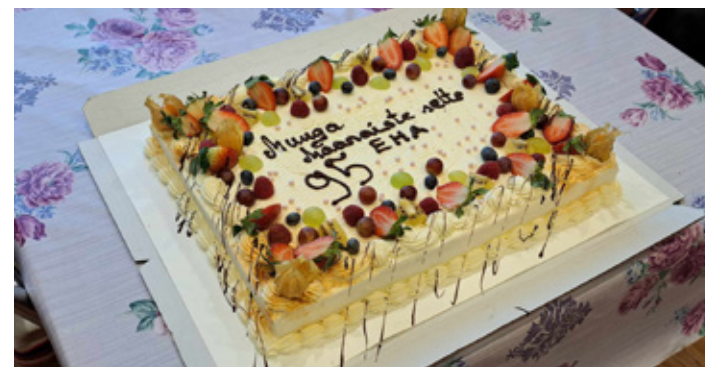
Muuga maanisteselts pidas 95. aastapäeva.