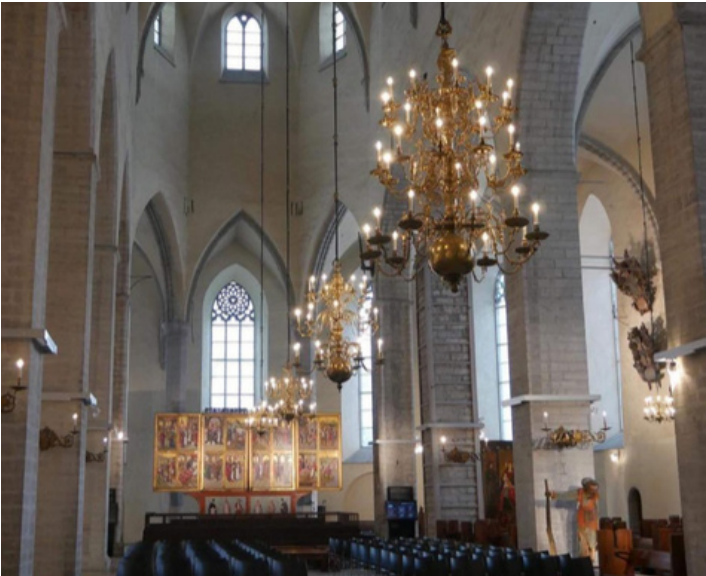
Kunstimuuseumi programm viis Vinni-Pajusti lapsed sel korral Niguliste kirikusse.