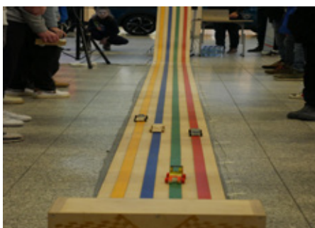
Täpsetele mõõtudele vastavad autod liikusid selleks ette nähtud rajal.

Meie kooli õpilastel oli see esimene kogemus osaleda nii suurel võistlusel, kust nad said omale uusi teadmisi.