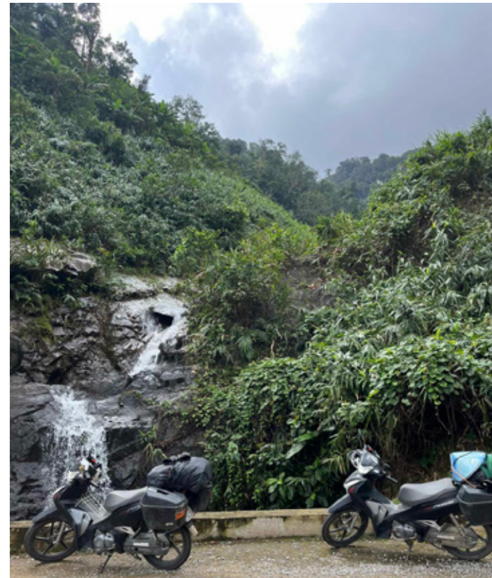
Vaated Vietnami mägedele.