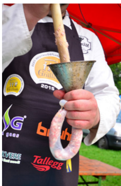
Võistlustel topitakse vorsti vanamoodi ehk pulga ja lehtriga.

Võisteldakse neljas võistlusvoorus. Esimeses voorus topitakse vorsti ja teises voorus grillitakse sedasama vorsti. Kolmas voor on üllatusvoor, selle vooru tooraine selgub võistluse avamisel. Esimese kolme vooru võistlustoorained annab osalejatele korraldaja, aga maitsestamine toimub võistkonna vabal valikul ja maitseainetega. Neljas ehk viimane voor on fantaasiavoort ja siin grillib igaüks mida ise soovib, see tähendab, et võistkonnad võtavad võistlusele selle vooru toorained ise kaasa. Fantaasiavoort töötab on oluline, et vähemalt üks põhikomponent on valmistatud grillil grillimise teel, muud toiduained, mida serveeritakse