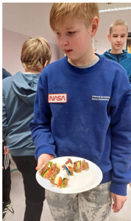
Õpilased leiba degusteerimas.

Laager õnnestus tänu tublidele töötajatele, kes õpilaste heaolu, turvalisuse ja