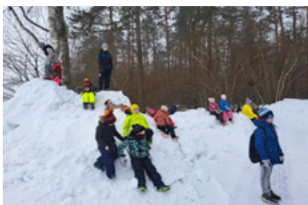
Matk Kellavere mäele.

Eraldi toon välja leivatöötoa, mis sai toetust koolikava kaasnevate haridus-