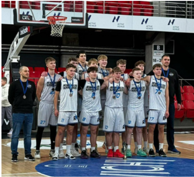
Reinar Halliku Korvpallikool/Vinni vald.

Turniiril varemgi just kolmandal veerandajal tugevat esitust näidanud Reinar Halliku KK tegi sedasama ka kolmanda koha mängus. Poolajapausile mindi veel napil RHKK eduseisul 42:38, kolmas mänguperiood võideti aga ülekaalukalt 32:6. BK Cēsis sellest šokist enam ei taastunud ning Euroopa kolmas noortevõistkond U17 vanuseklassis on Reinar Halliku Korvpallikool/Vinni Vald.