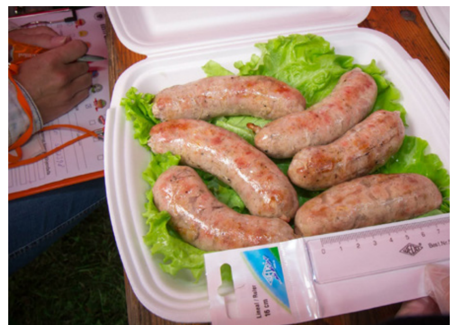
Võistlusel keerutatakse ja grillitakse kindla pikkusega vorstid.

Võistkondade töid hindavad nii Eesti Grilliliidu kohtunikud kui ka kohapeal koolitatud Vinni valla aukohtunikud. Grillivõistluse tööde hindamine toimub Eesti Grilliliidu võistlusformaadi alusel ja siin hinnatakse roa välimust, valmidust ja maitset, fantaasiavoortu ka ideed