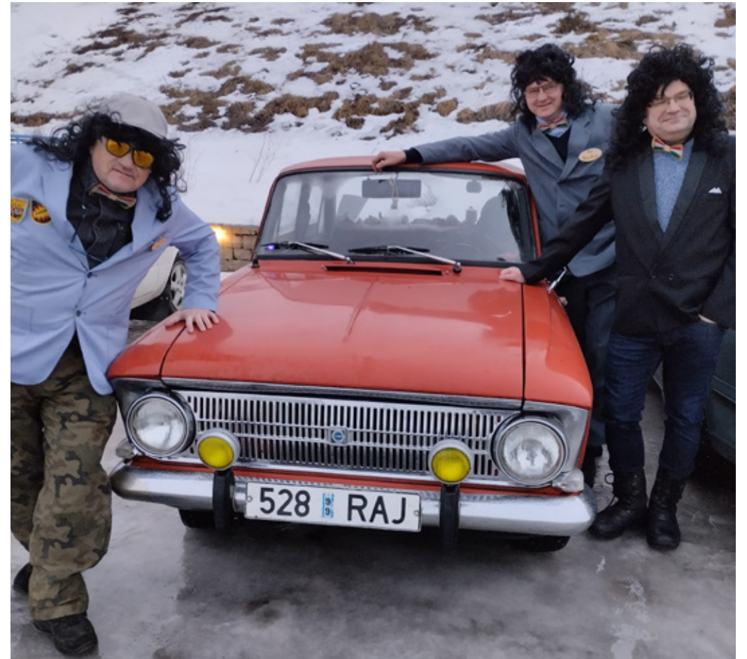
VPG õpetajad käisid uunikumiga talverallil.