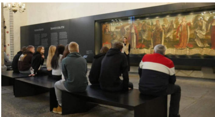
Muuhulgas tutvuti Notke kuulsa „Surmatantsuga“.