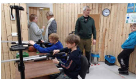
Lasketiiruga tutvumas.

meetmete raames PRIAlt. Merike küpsetas erinevaid leibasid ja tegi määrdeid, millega õpilased said endale huvitavaid tikuleibu kokku panna. Seejärel degusteeriti põnevaid maitseid kaaslastega neljastes laudkondades.