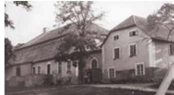
Kūti mõis 1972.a.

1473 – 550 aastat Kūti mõisa (saksa k Kurküll) esmamainimisest kirjallikes allikates.