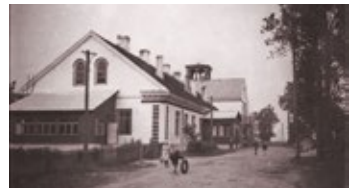
Ulvi mõis 1965.a.

1498 – 525 aastat Ulvi mõisa esmamainimisest.