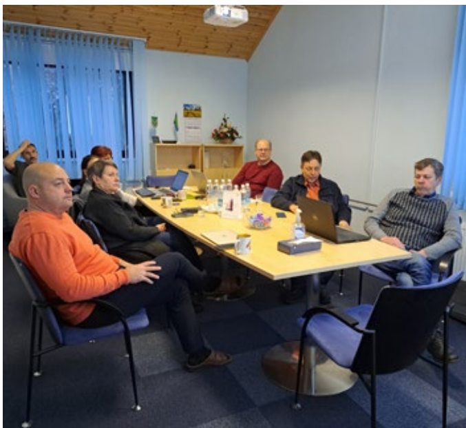
Vinni valla kriisikomisjon lauaõppusel „KOV-79 SÄRTSU“.