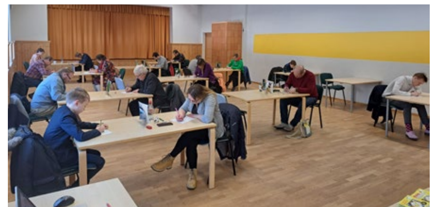
Aega sudokute lahendamiseks on 1,5 tundi.