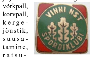
Vinni NST spordiklubi rinnamärk.

1958, jaanuar – 65 aastat tagasi asutati Vinni NST kehalikultuurikollektiivi. Sport Vinnis hakkas sestpeale pisitasa, aga järjekindlalt tuntust koguma: võrkpall, korvpall, kergejõustik, suusatamine, ratsutamise, male-kabe, lauatenis, koroon, mälumäng, judo, auto-motosport,