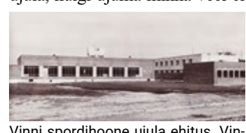
Vinni spordihoone ujula ehitus.

1988, juuni – 35 aastat tagasi võttis ehituse vastuvõtukomisjon vastu Vinni spordihoone siseujula, kuigi ujuma veel ei saanud.