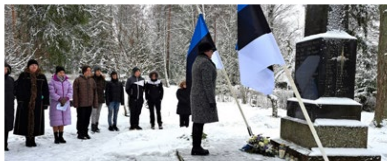
Austame neid, kes andsid oma elu Eesti vabaduse eest.