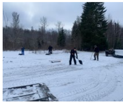
Suusaraja parandustööd.