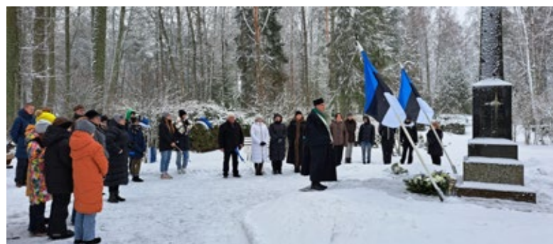
Tartu rahulepingu aastapäeva tähistamine Viru-Jaagupi kalmistul.