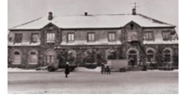
Rakvere tarbijate kooperatiivi universaalkauplus 1980ndatel Laekveres. Eesti Arhitektuurimuuseum EAMFK9609.