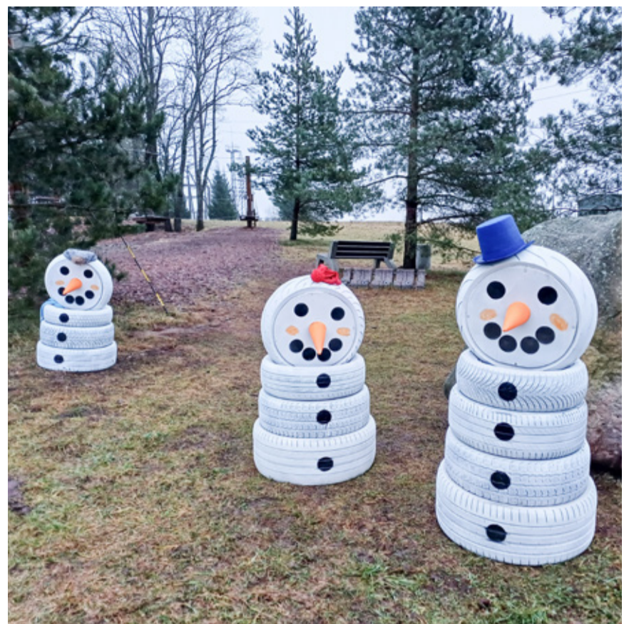
Ettevõtja Lauri Tamm tegi oma meeskonnaga Laekverre madalseiklusraja serva vanadest rehvidest lõbusad lumememmed.