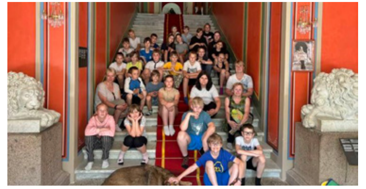
Lapsed külastasid Muuga kunstimõisa.