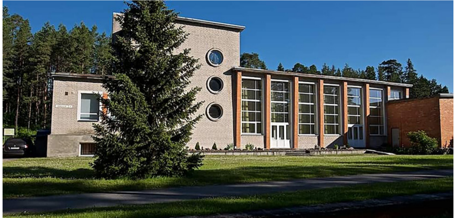
Roela rahvamaja saab endale uue energiatõhusa kuue.