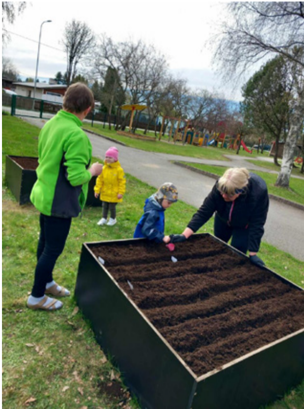
Seemned mulda.

Erilised tänusõnad kuuluvad ka lapse-vanematele, kes on oma lapsi toetanud ja võimaldanud neil koolitöös ja