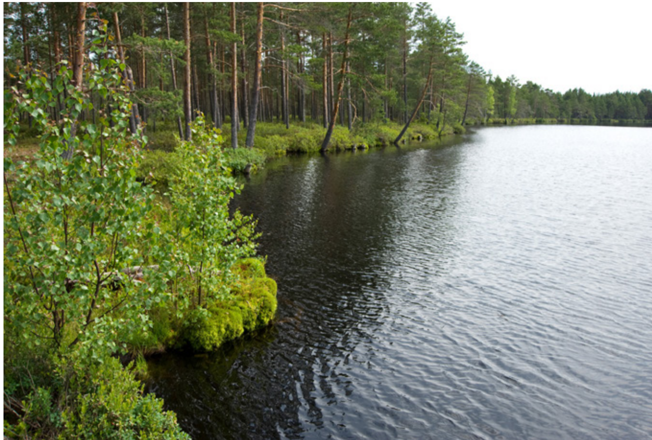
1. Tudu rabajärv.