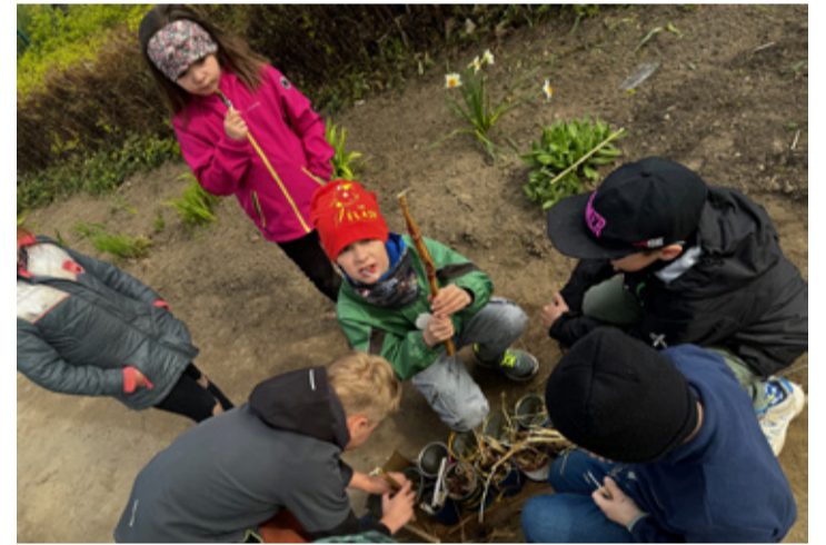
Teeme putukatele kodu.