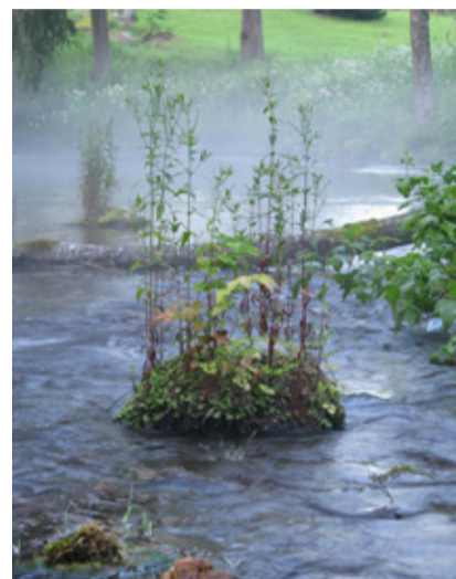
3. Lavi allikas.