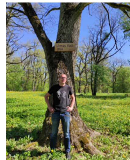
10. Vinni-Pajusti tammik.