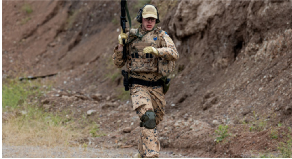
Isikukaitseoperatsioonidel peavad sõdurid olema valmis kiiresti, otsustavalt ja automaatselt reageerima ükskõik mis ohule. Õnneks seni pole ohtlikke olukordi ette tulnud ning vajalikke oskusi käiakse lihvimas kohalikus tiirus.

Sellist rutiini nagu Eestis, kus väljaspool õppu-