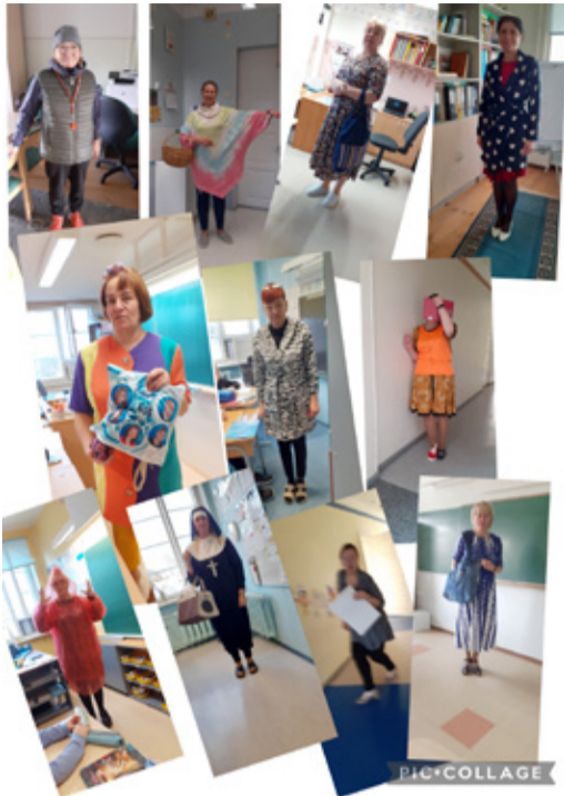
Naljapäeval olid au sees nii naljakad riided kui koolikotid.