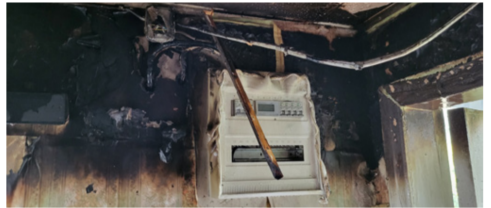
Elektrisüsteemi rikked põhjustasid mullu 65 põlengut.

Sageli ei teki tuleohtlik rike ootamatult, vaid sellele eelnevad mingid märgid. Näiteks valgustite vilkumine, särisevad helid, nähtavad sädelused pistikutes, logisevad pistikupesad, juhtmete isolatsiooni sulamisel tekkiv iseloomulik lõhn, kaitselülite näiva põhjusest väljalülitumised vms. Need on selged märgid, et elektripaigaldisega on midagi korrast ära ning selle kasutamine ei ole ohutu. Teisest küljest, kuna elektripaigaldise erinevad osad asuvad tihti peidetult näiteks seinte sees või ka ruumides, kus sageli ei käida, siis tekib elektrilisel põhjusel tulekahjusid sageli ka ootamatult.