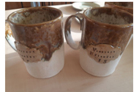
Venevere mälumängusarja auhinnakruusid.

Seekord tegid ilusad savist kruusid parimatele Venevere naistele. Reklaami teeksime ka meeleldi – saalis on ruumi piisavalt, nii et oktoobris on ka uued võistkonnad oodatud.