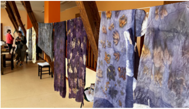
Veneveres on tehtud aasta jooksul erinevat näputööd – keraamikat, taimetrükis salle, mööbli restaureerimist, jõulukuule.