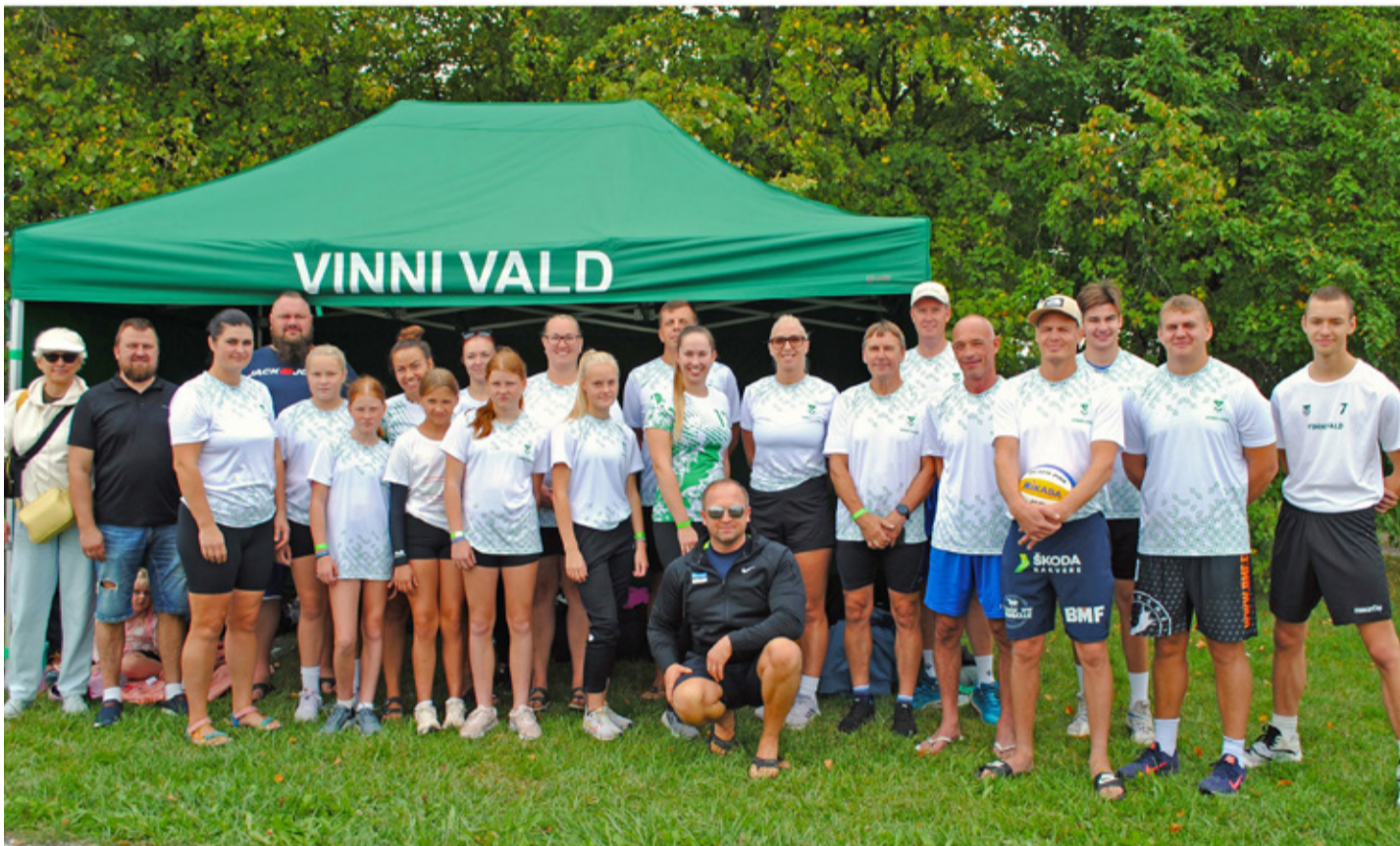
Osa Vinni valla võistkonnast Eestimaa valdade suvemängudel 17.8.2024 Kuressaare staadionil.