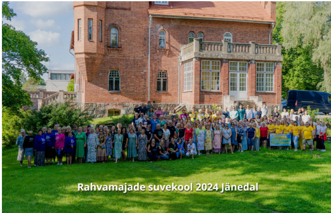
Rahvamajade suvekool 2024 Jänedal