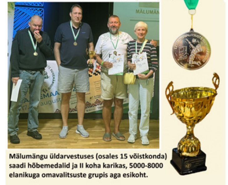
Mälumängu üldarvestuses (osales 15 võistkonda) saadi hõbemedalid ja II koha karikas, 5000-8000 elanikuga omavalituste grupis aga esikoht.